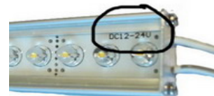
LED listan käyttöjännite on merkitty plus johtimen viereen.