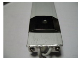
Kiinnikkeet tulevat LED listan takapuolelle.