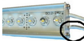
Miinus johdin on merkitty harmaalla viivalla.