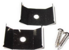
Kiinnikkeet ja ruuvit.