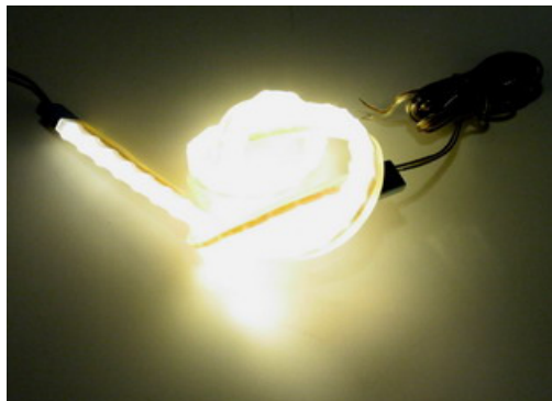
LED letku taipuu vaikka solmuun.